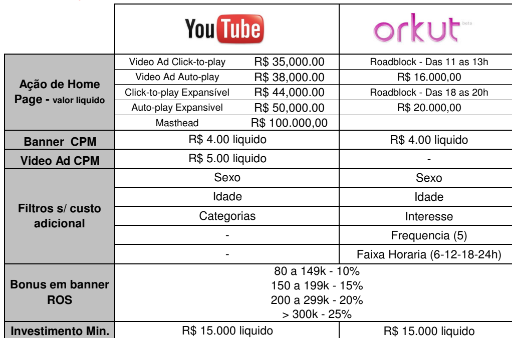
Tabela válida a partir de 1º de outubro.